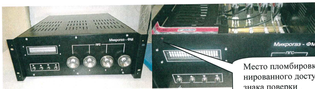
Рисунок 1 – Общий вид установки «Микрогаз-ФМ» мобильного исполнения

Место пломбировки от несанкционированного доступа и нанесения знака поверки